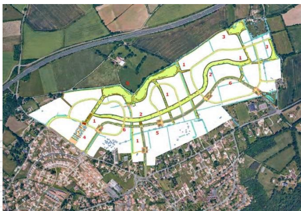
Vue en plan de l'aménagement (Etudes préliminaires)