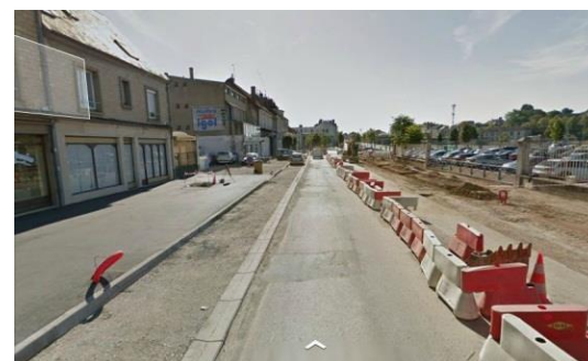
Rue et parvis en cours de travaux