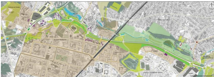
Schéma de référence de l'Avenue du Parisis

Etudes technico-fonctionnelles préalables à la DUP - volet conception urbaine, paysagère et transport