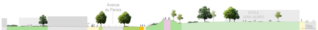
L'Avenue, point de départ d'un renouveau pour le quartier des Lochères (Sarcelles, 95)