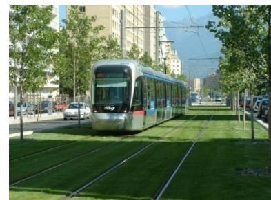
Tramway de Grenoble

Le contrat, d'un montant de 1,1 million d'euros, s'accompagne du gain de l'accord-cadre de maîtrise d'œuvre de renouvellement urbain de la ville de Pont-de-Claix pour un contrat d'un montant de 800 k€.